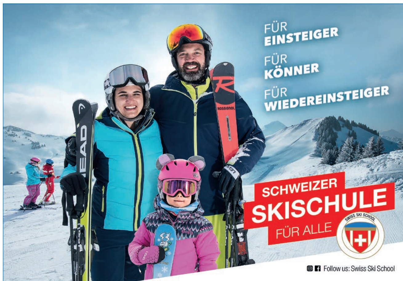
Abb. 2: Schweizer Skischule für Alle

Die Lektionen in dieser Academy zeigen Möglichkeiten auf, den Unterricht zielorientiert und erlebnisreich zu gestalten.