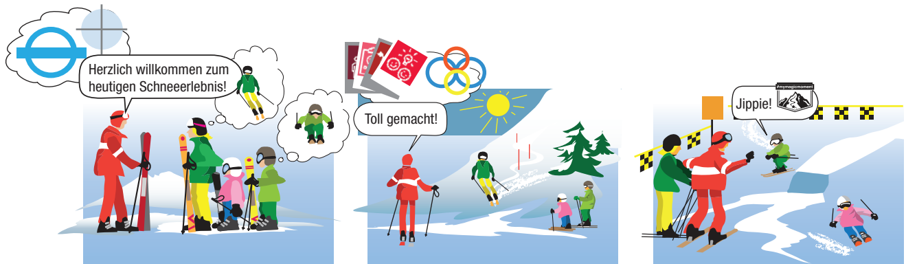
Abb. 5: Erlebniskettenelement «Unterricht»